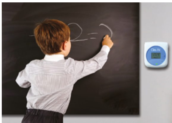
Boitier pédagogique Class'Air / PYRESCOM

Dans ta classe, la qualité de l'air peut être surveillée à l'aide de boîtiers qui mesurent