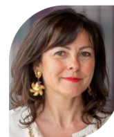
Carole DELGA Présidente du Conseil régional Occitanie